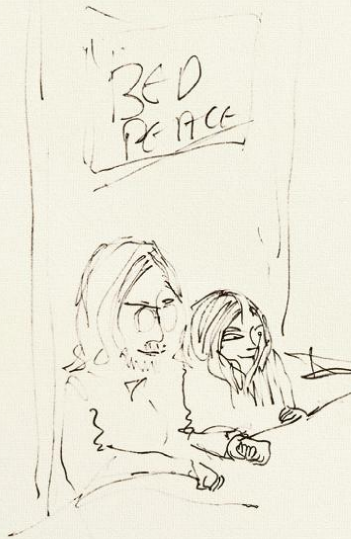
« Bed-in for peace ».

Il y a quarante ans, Yoko Ono et John Lennon se servaient de leur lit d'hôtel à Montréal pour manifester contre la guerre au Vietnam. Yoko Ono a accepté de marquer l'anniversaire avec Libération . Dans deux semaines, elle sera à Venise, où la Biennale d'art contemporain lui remettra un Lion d'or pour l'ensemble de son œuvre. Lunettes noires, bibi et tailleur anthracite, rencontre avec M me Ono en mars, lors de son passage à Montréal, où elle ouvrira, au musée des Beaux-Arts une exposition consacrée au « bed-in » et à son art. Les accrochages sont toujours des exercices de tension et de doute