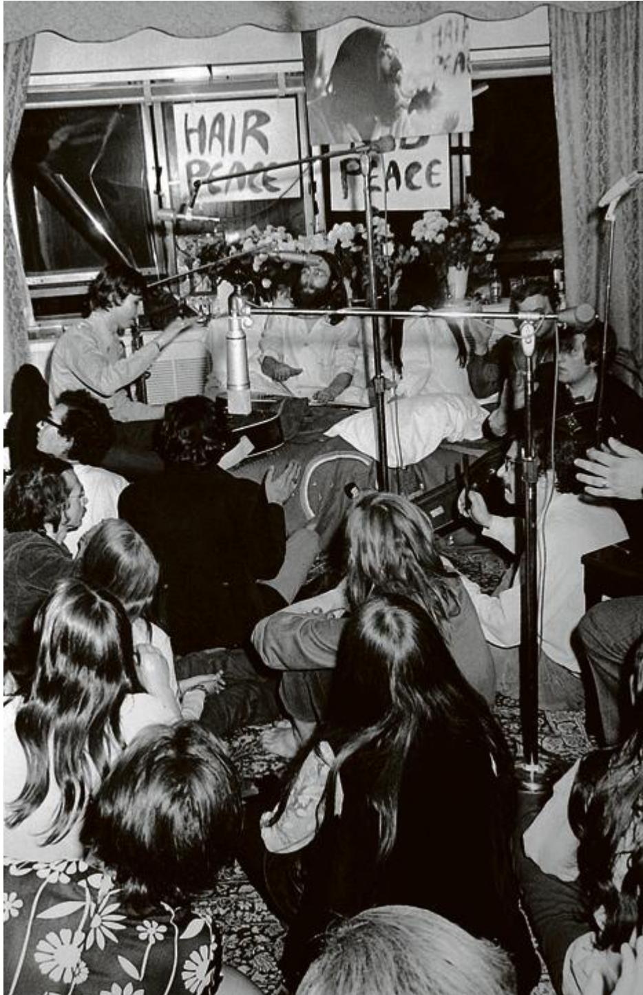
Pendant le «bed-in», artiste et fans chantent Give Peace a Chance .