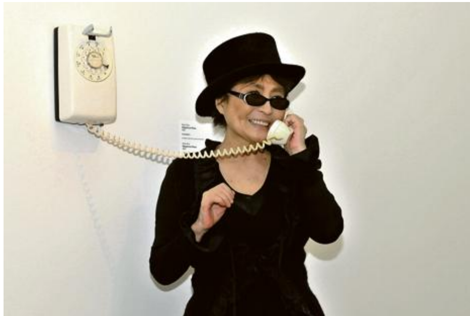
Yoko Ono appelle régulièrement les visiteurs de son expo.

L'exposition commémorant le bed-in à Montréal retranscrit le parcours et l'univers de Yoko Ono.