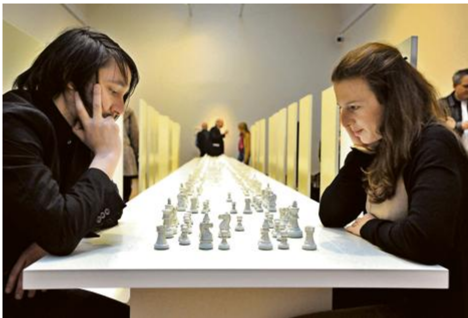
Le public joue aux échecs avec des pièces blanches.