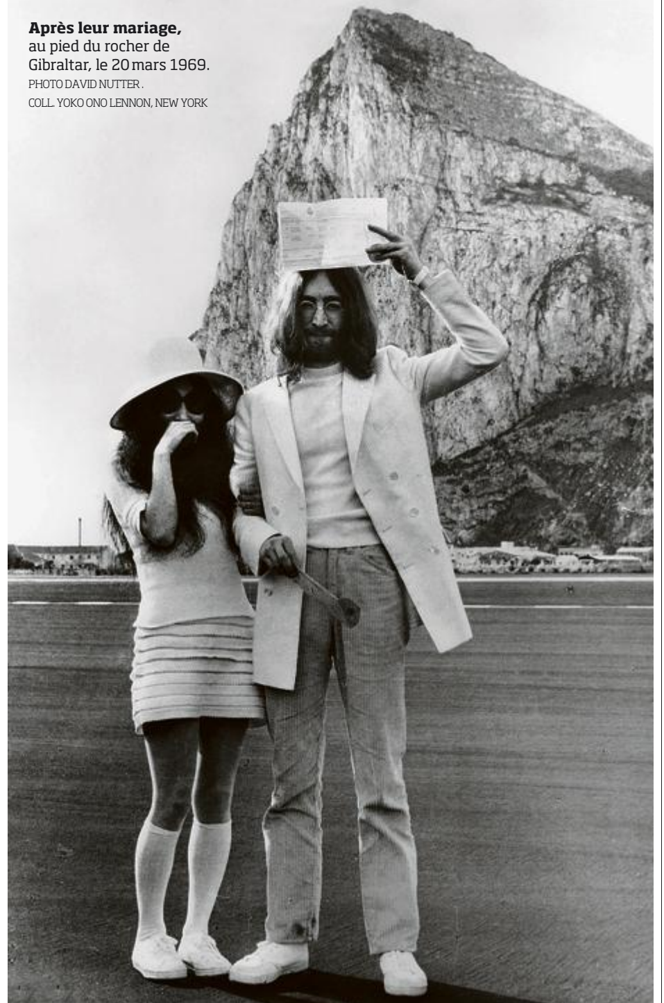
Après leur mariage, au pied du rocher de Gibraltar, le 20 mars 1969.