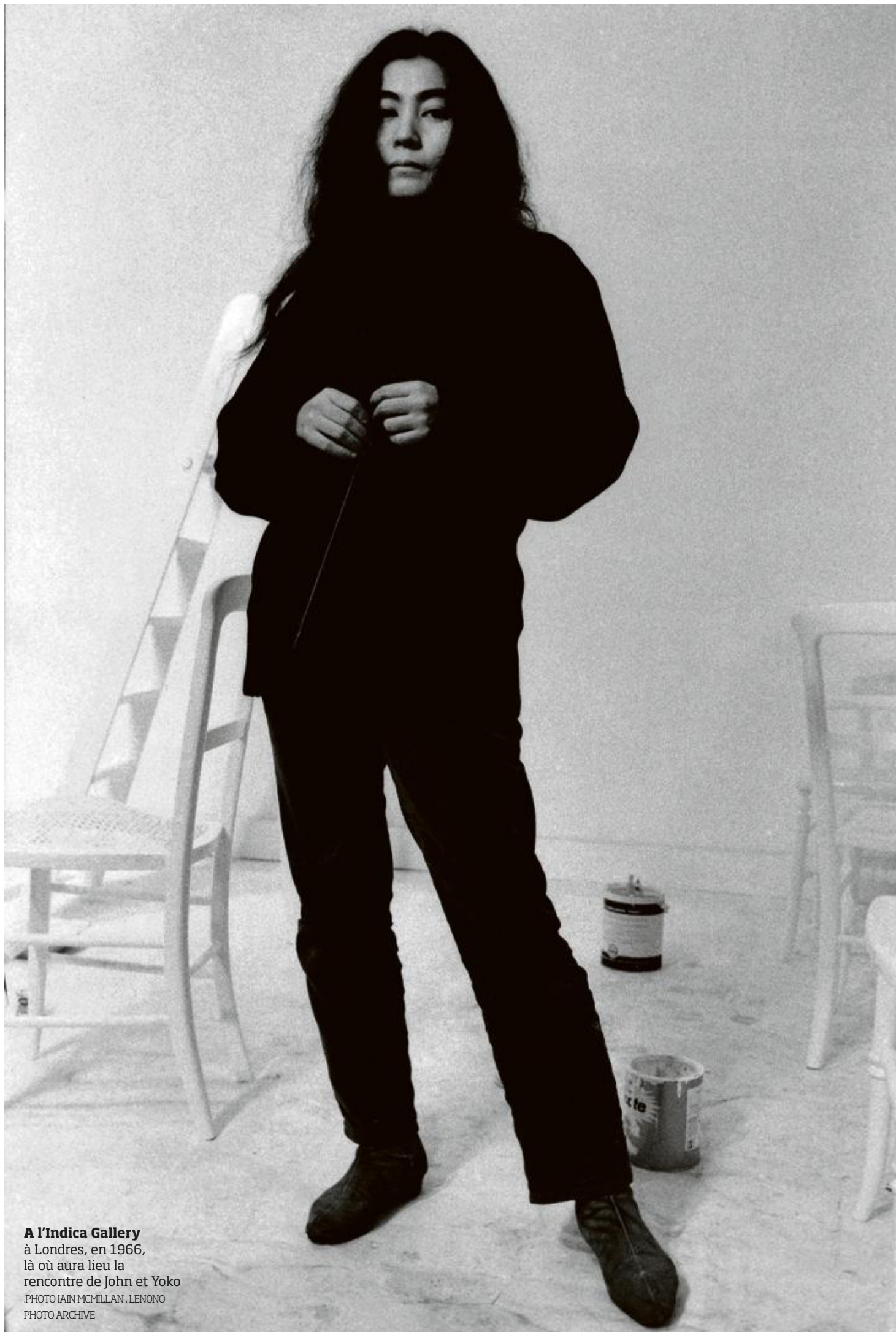
A l'Indica Gallery à Londres, en 1966, là où aura lieu la rencontre de John et Yoko