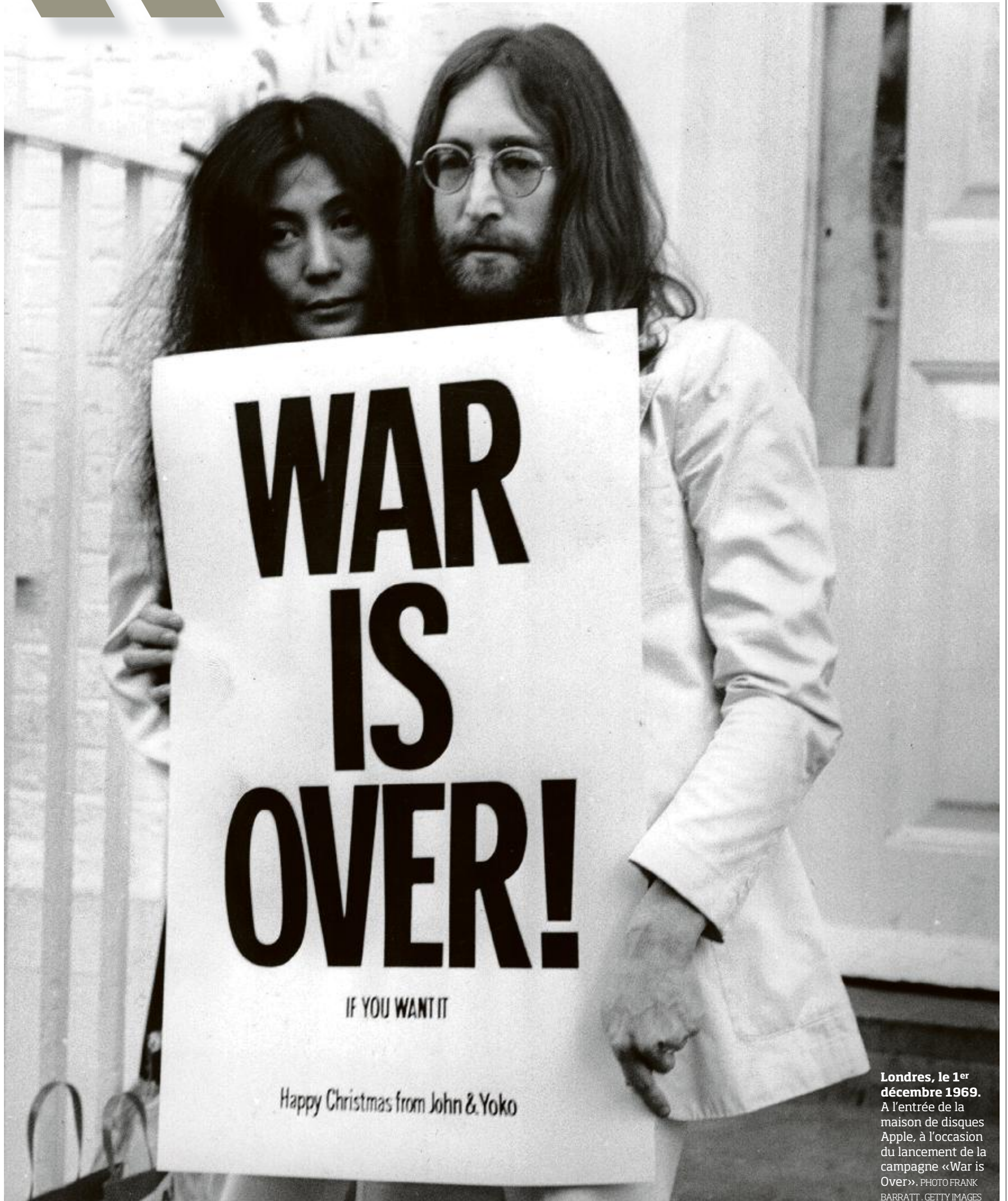
Londres, le 1 er décembre 1969. A l'entrée de la maison de disques Apple, à l'occasion du lancement de la campagne «War is Over».