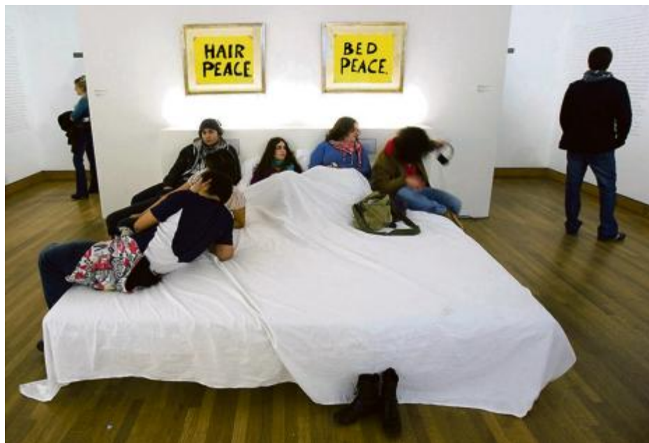
Le «peace bed» reconstitué, que les spectateurs sont invités à s'approprier.