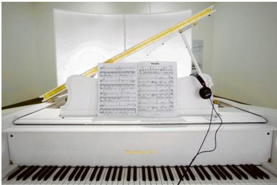
Piano blanc avec la partition de Imagine .