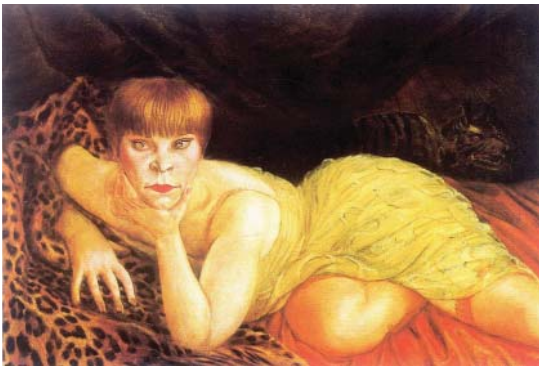
Femme étendue sur peau de léopard, 1927. Herbert F. Johnson Museum of Art, Cornell University, Ithaca, don de Samuel A. Berger. © Succession Otto Dix / SODRAC (2010)

Réservez tôt! Le nombre de place est limité. Coût : 125 $