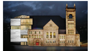
PAVILLON Claire et Marc Bourgeois ART QUÉBÉCOIS ET CANADIEN

1 Les Salons de la Belle Époque Avant-gardes modernes Abstraction et figuration Art contemporain Accès aux autres pavillons