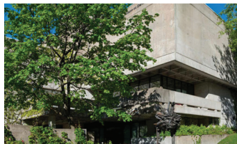
PAVILLON Liliane et David M. Stewart ARTS DÉCORATIFS ET DESIGN

S1 Cinéma du Musée Auditorium Maxwell-Cummings Entrée située au 1379-A, rue Sherbrooke O.