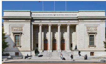
PAVILLON Michal et Renata Hornstein

S2 Art contemporain international Richard Avedon : Immortel. Portraits du temps qui passe, 1951-2004 Hors socle : sculptures des années 1960 à nos jours dans la collection