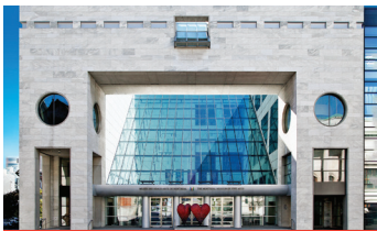
PAVILLON Jean-Noël Desmarais