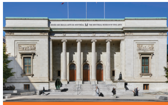
PAVILLON Michal et Renata Hornstein

S2 Art contemporain international Marie-Claire Blais : Lumières déferlantes Le confort et l'indifférence : acquisitions récentes du MAC