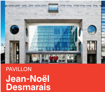
PAVILLON Jean-Noël Desmarais