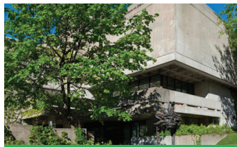
PAVILLON Liliane et David M. Stewart

S1 Cinéma du Musée Auditorium Maxwell-Cummings Entrée située au 1379-A, rue Sherbrooke O.