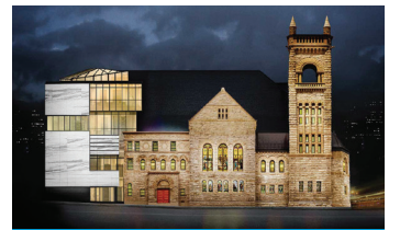
PAVILLON Claire et Marc Bourgie ART QUÉBÉCOIS ET CANADIEN

1 Les Salons de la Belle Époque Avant-gardes modernes Abstraction et figuration Art contemporain Accès aux autres pavillons